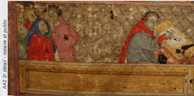
AA2 2r détail - notaire et public